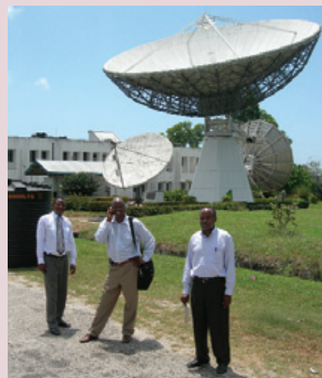
Misión de seguimiento en Tanzania

En el cuarto trimestre se completó la transferencia del software genérico del PFC CPE (véase el Boletín N° 36). Se exhorta a los actuales usuarios a descargar del sitio de EIS (ingresando su nombre de usuario y contraseña) los tres módulos que integran la Versión